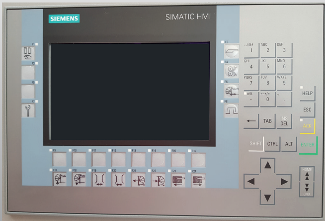
Neues Panel KP900